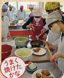
うまく焼けたかな

女性部員が見守る中、児童は野菜を切ったり、切った具材を混ぜたりと、丁寧に調理していました。どらやきを焼くときは、火が強くて「焦げちゃった！」とハプニングも。しかし何枚も焼くうちに、火